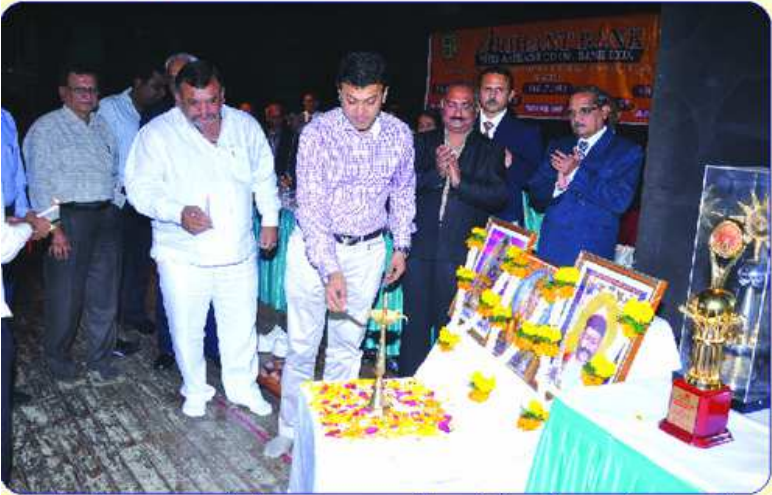
Valuable Customers સાથે દીપ પ્રગટ્ય કરતા બેંકના ચેરમેન શ્રી કુમાર દંડ તથા ડાયરેક્ટરો