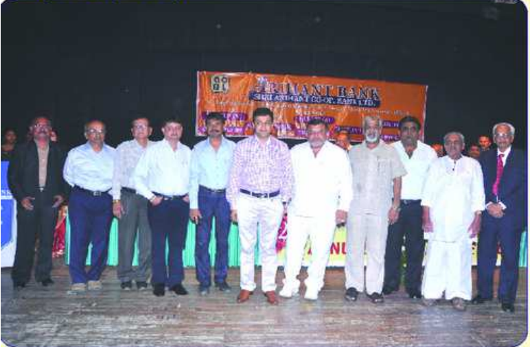
મહાનુભાવો સાથે બેંકના ચેરમેન, વાઈસ ચેરમેન તથા ડાયરેક્ટર્સ