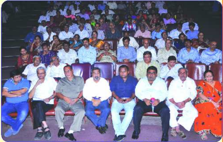
બહોળી સંખ્યામાં ઉપસ્થિત શેઝ્વારકો