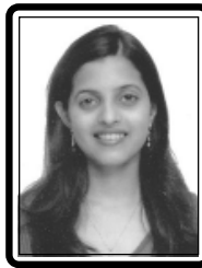
અ.સૌ.લોપા જીગર સંઘવી C.A.માં પાસ થયેલ છે.