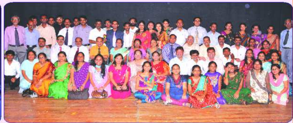
श्री अरिहंत बँकनुं कर्मचारीगण